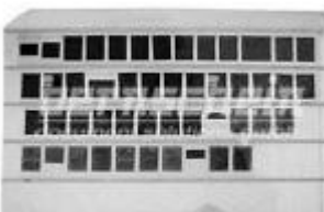
Jackets 5-bahnig; simplex