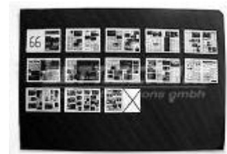
Rasterfiches 25-fach; Standbildkamera, positiv