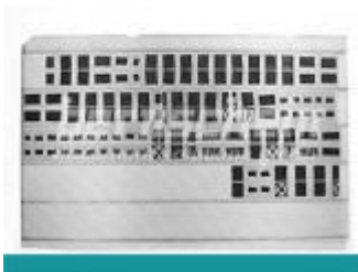
Jackets 5-Bahnig; duplex